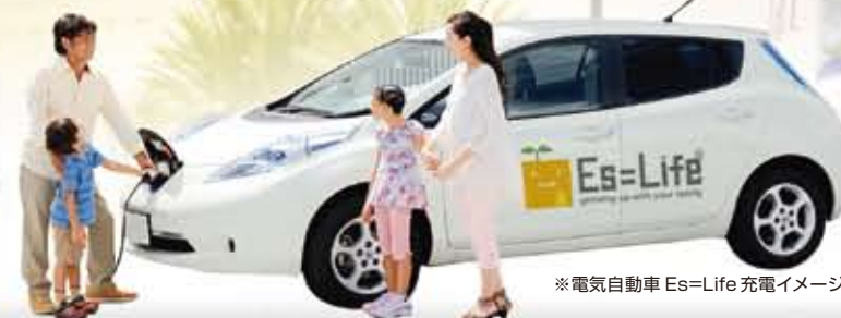
※電気自動車 Es=Life 充電イメージ

建売販売会! 日時 2/9(土)・10(日)・11(月) 受付時間 10:00~18:00